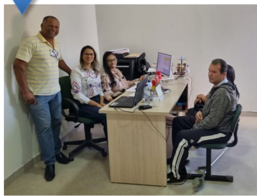
CEJUSC itinerante em São João Evangelista (Município de Coluna). Equipe do CEJUSC durante audiência.

Os municípios de São Geraldo da Piedade, Santa Efigênia de Minas e Coluna receberam, respectivamente nos dia 23, 24 e 25 de agosto, mais uma edição do projeto Cejusc Itinerante.